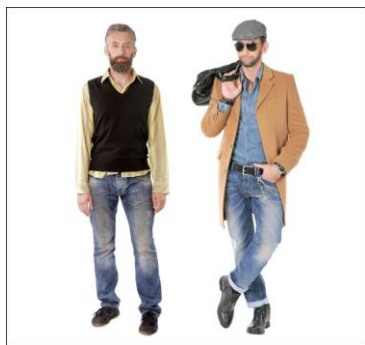
Рисунок 1 - Гардероб № 1