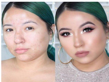
Рисунок 1 — Фотография «ДО» / «ПОСЛЕ»

Если наименование рисунка состоит из нескольких строк, то его следует записывать через один межстрочный интервал. Наименование рисунка приводят с прописной буквы без точки в конце. Перенос слов в наименовании графического материала не допускается.