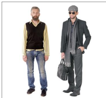
Рисунок 2 – Гардероб № 1

На каждой странице приложения после нужным образом размещенных картинок и текста рекомендуется использовать опцию «Разрыв страницы», который можно вставить вручную. Это не позволит тексту и картинкам «съезжать» и нарушать структуру работы. Для этого необходимо установить курсор там, где нужно завершить одну страницу и начать новую. Выберите Вставка> Разрыв страницы.