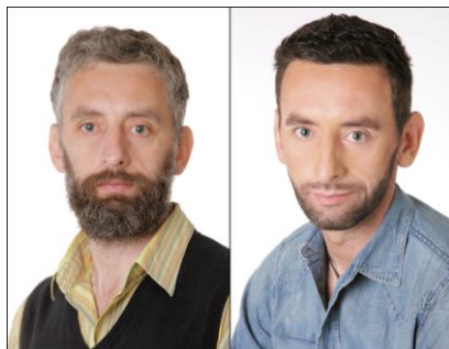
Рисунок 1 - «До и после»